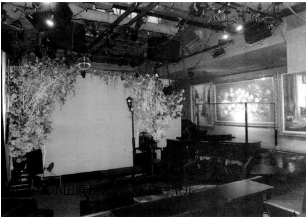
▲ギャラリーのような雰囲気の店内